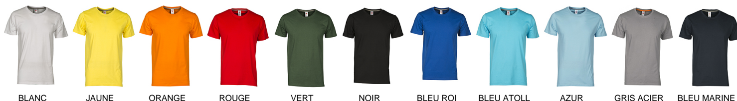
BLANC JAUNE ORANGE ROUGE VERT NOIR BLEU ROI BLEU ATOLL AZUR GRIS ACIER BLEU MARINE