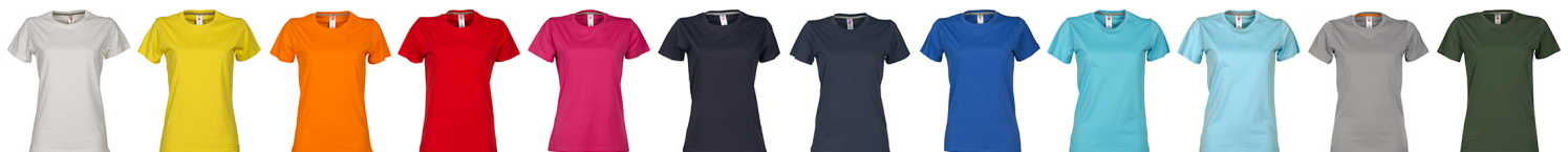
BLANC JAUNE ORANGE ROUGE FUCHSIA NOIR BLEU MARINE BLEU ROI BLEU ATOLL AZUR GRIS ACIER VERT